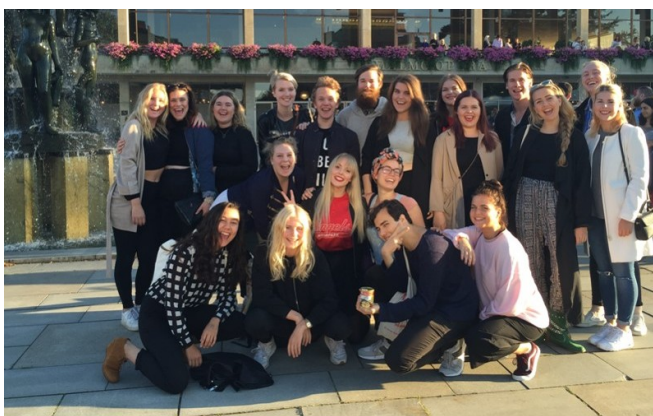
Musikelever från Östra Greve

Årets Lunch den 14 januari blev en succé!